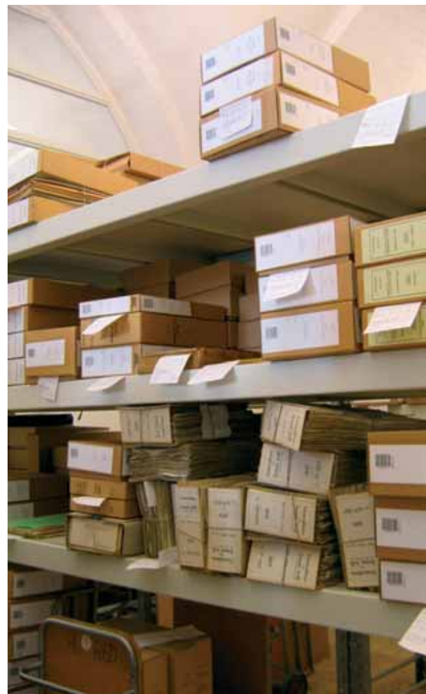
Rigsarkivets reoler til afhentning af bestilte arkivalier.